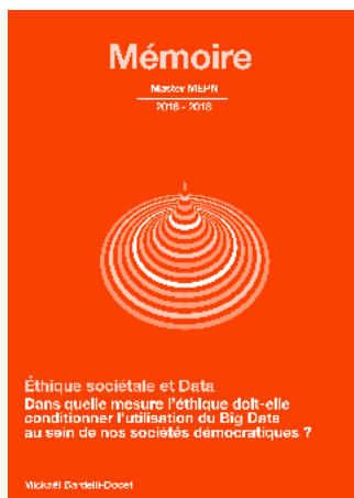
Mickaël Bardelli-Doce, mémoire de Mastère

Le programme de formation se déroule sur deux années scolaires.