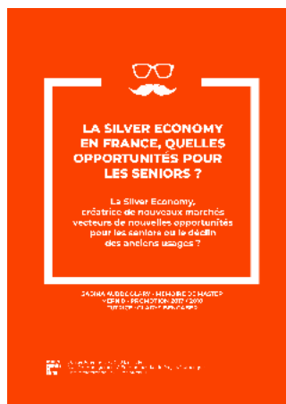
Sabina Audboulary, mémoire de Mastère