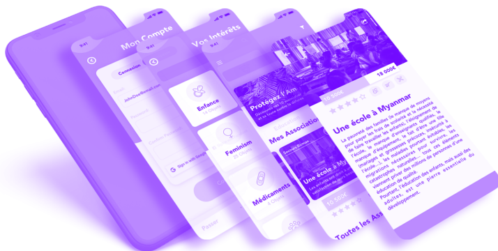
Projet professionnel et son application mobile pages 2, 3 et 4

L'alliance entre un design efficace et un design esthétique. La conception d'interfaces interactives demande des compétences en design graphique, mais aussi l'investissement du champ ergonomique — UX design indispensable à la bonne « utilisabilité » du site.