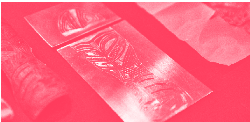
Projet d'impression utilisant le procédé de gravure à l'Eau-Forte. Réalisé au cours d'un Workshop encadré par Clément Fourment.

La deuxième année du titre Designer-e en communication graphique écoresponsable spécialité Print a pour objet la maîtrise de la chaîne graphique, du perfectionnement dans la maîtrise des logiciels de mise en page jusqu'aux techniques d'impression et de fabrication. Les étudiant-es sont amené-es à augmenter leur niveau technique par le biais de sujets donnés tout au long de l'année, ainsi qu'à compléter leurs connaissances par la rencontre de professionnel-les des différents domaines de l'objet imprimé.