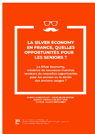
Sabina Aubdoolary, mémoire de Mastère