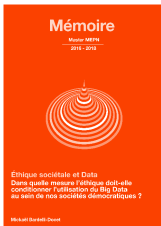
Mickaël Bardelli-Doce, mémoire de Mastère

Le programme de formation se déroule sur deux années scolaires.